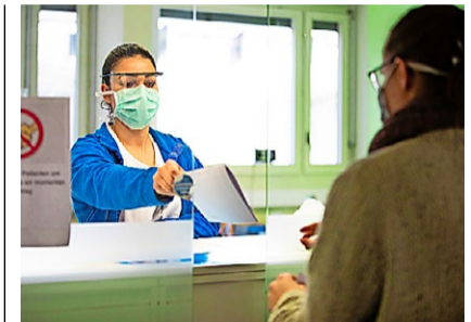
Coronatests können im Kantonsspital Olten neu mit Anmeldung gemacht werden, um Wartezeiten zu umgehen.

Infos zur Bestellung der CD und mehr Wissenswertes über Armin Bachmann finden Sie online unter www.arminbachmann.ch